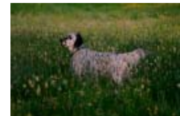
ChIB.ChB. Tr. Donat vom Teutoburger Wald (hunting dog)