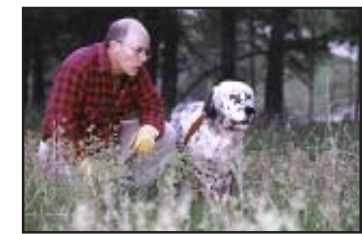
Pinecoble Fall Pride hunting dog