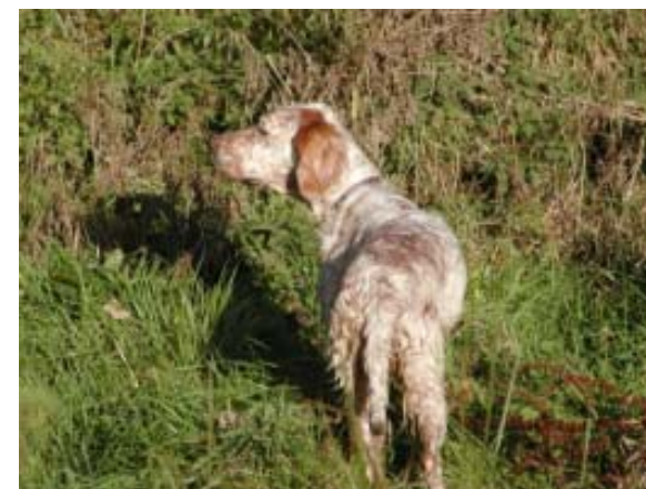
Tr. Rangers Comtessa (hunting dog)