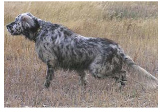
Timbers Blueman Group (hunting dog)

Tr. = placement on a Field Trial with excl. or very good