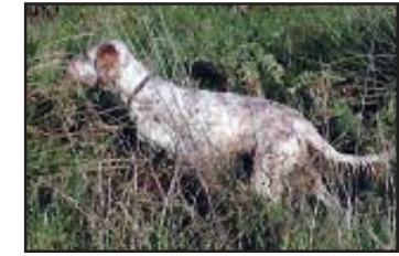
Tr. Rangers Comtessa hunting dog