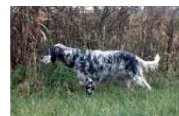
Dual-FTCh. Norne Mc Elwyn (hunting dog)