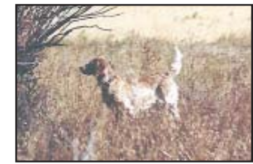
Timbers Creme Caramel hunting dog