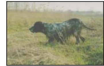
Tr. Rangers Arno hunting dog