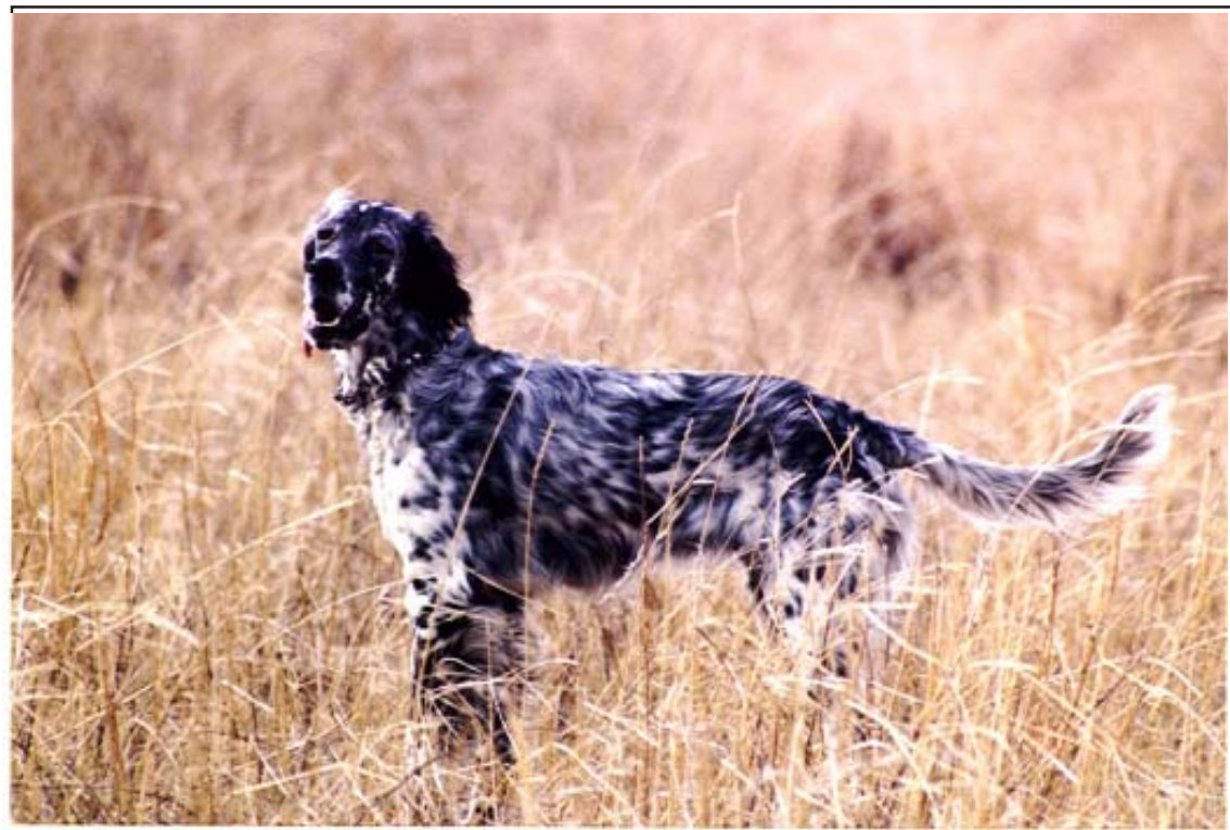
Rangers Daybreak (Hunting Dog)

Tr. = placement on a Field Trial with excl. or very good