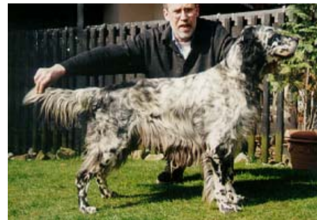
Tr. Rangers Arno (hunting dog)