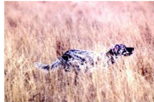
Rangers Daybreak (hunting dog)