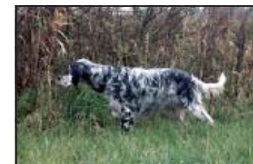
Dual-FTCh. Norne Mc Elwyn (hunting dog)